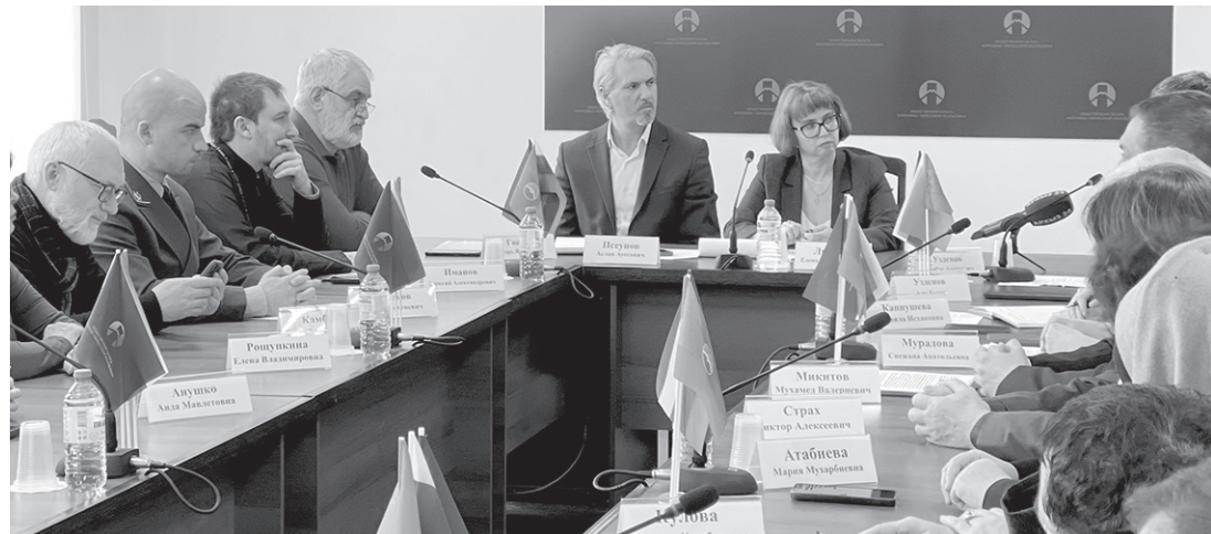
В Общественной палате КЧР говорили об особенностях российского подхода к правам человека