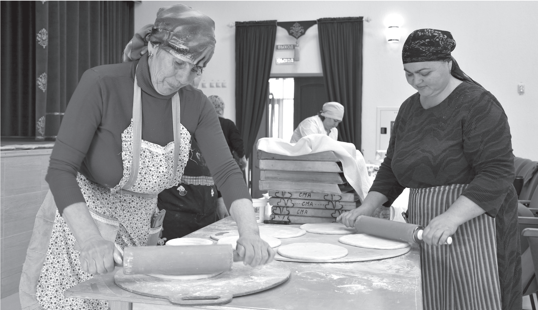
Волонтеры вложили в приготовление блюд для участников СВО тепло своих сердец