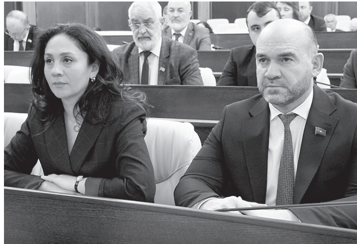
Парламентарии обсудили более 20 вопросов повестки

Далее рассмотрен проект конституционного закона КЧР «О внесении изменений в статьи 8 и 68 Конституции Карачаево-Черкесской Республики». Законопроект разработан с целью приведения Конституции КЧР в соответствие с Конституцией РФ по предложению прокурора республики.