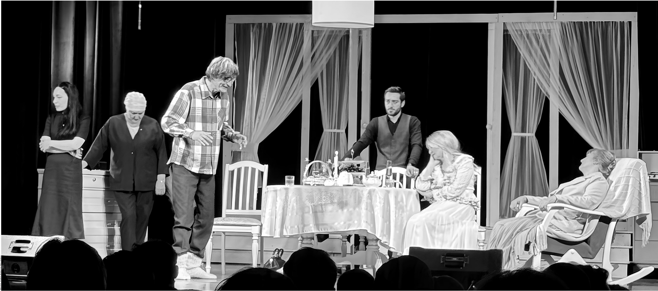
Сцена из спектакля «Ретро»

Словом, особой оригинальностью не отличается, но ведь любую пьесу превращает в действо актёрская игра. А позже в глаза