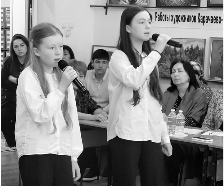
На мероприятии прозвучали стихи на абазинском языке

В ходе видеопрезентации собравшиеся ознакомились с военной биографией абазинских писателей и поэтов, узнали ключевые факты их биографии, увидели их награды, список написанных ими произведений, а