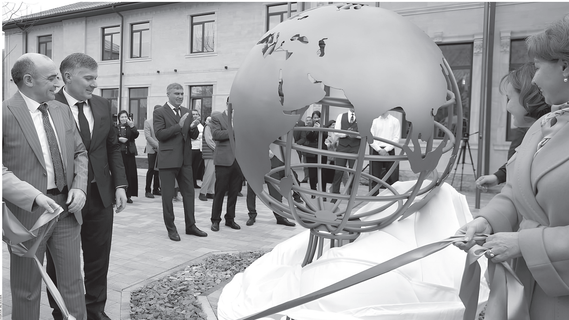
Новоселье факультета удалось на славу

Во дворе нового здания собралось множество людей. Звучат Гимны РФ и КЧР. От имени Главы республики Рашида Темрезова